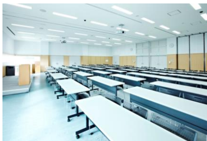
多目的会議室A・B(連結)

さんさん館3階にある多目的会議室は、2室を連結すれば、100人規模の会議や集会の他、音楽やダンスの練習、幼稚園のお楽しみ会などで使用することもできます。